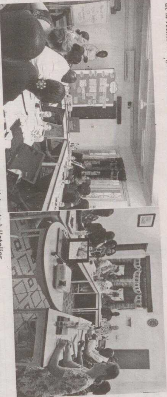
ICA: Les participants à l'atelier

Le Vendredi 9 Octobre 2015, l'initiative du Cajou Africain (iCA) a organisé une revue du projet à Ouagadougou afin d'offrir à ses parties prenantes une profonde analyse des résultats atteints au cours des 3 dernières années et discuter des chemins d'avancements du cajou au Burkina Faso. Le principal point fort de l'atelier a été les présentations délivrées par les partenaires du Fond de Contrepartie de iCA, que sont l'INERA, le CNSF, GEBANA, ANA-TRANS et l'UNPA et celle sur les résultats de l'enquête annuelle de rendement par l'Institut de l'Environnement et de la recherche agricole (INERA).